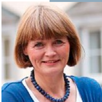
Klaudia Zepunkte (Bürgermeisterin der Landeshauptstadt Düsseldorf)