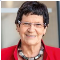
Prof. Dr. Rita Süssmuth (Bundstags- präsidentin a.D.)